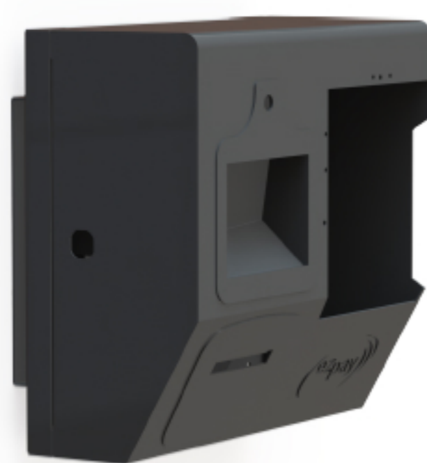
بدنه دستگاه شارژ خودکار بلیت